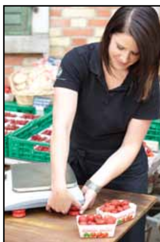
Jednoduše nastavitelné nožičky