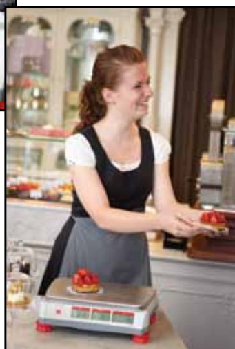
Prodejna cukrovinek a sladkostí