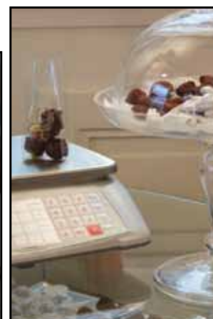
Cukrovinky, čaj, čokoláda