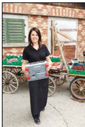
Jednoduché přenášení váhy díky dvěma výčňelky na spodní straně