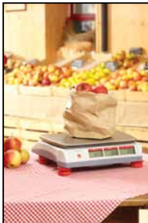
Trhy s ovocem a se zeleninou

Aviator 5000 je stylová, přenosná maloobchodní váha vhodná do různého maloobchodního prostředí, jakými jsou otevřené trhy, mobilní prodejny nebo menší specializované obchody. Díky její robustní a lehké konstrukci, včetně vysoce kvalitní vážicí misky z nerezové oceli jsou ideální pro všechny typy prostředí, kde hygiena potravin, přenosnost a odolnost jsou hlavním kritériem. V kombinaci s vysokokvalitní technologií vážení jsou váhy Aviator spolehlivou a dlouhotrvající investicí. Použití vah Aviator je rychlé a snadné díky své ergonomické klávesnici a jednoduchému uživatelskému rozhraní - tedy umožňuje zrychlení odbavení zákazníků ve všech aplikacích.