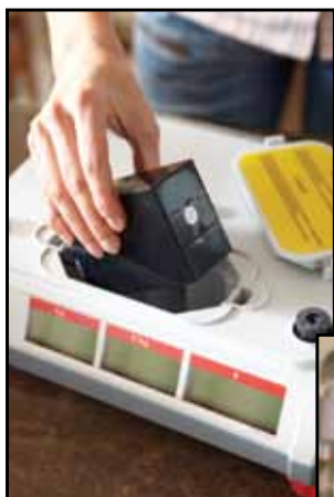
Mobilní obchod s dobíjitelnými bateriemi