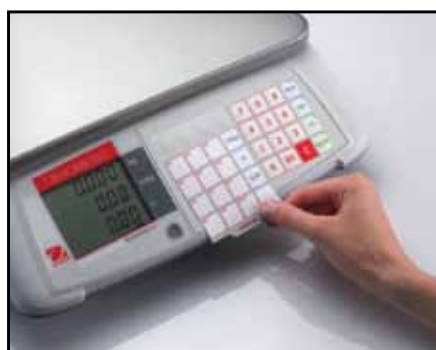
Vyměnitelná karta přednastavených položek